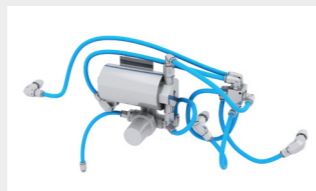
散水システム (ベーシック&ハイフロー) 冷却と混合の二重機能を備える