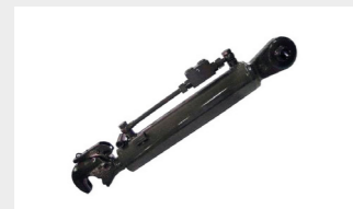
油圧トップリンク