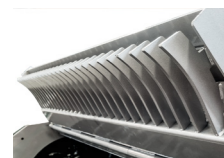
リアグリッド リアドアのグリッドは 処理された資材のサイズ規定に有用