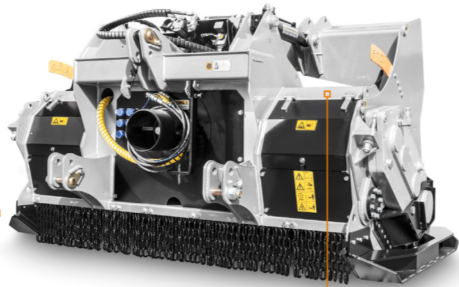
可変容量チャンバー この技術革新的ソリューションは、業界で他に類を見ないので、 ローターだけで地表面を貫通することが可能